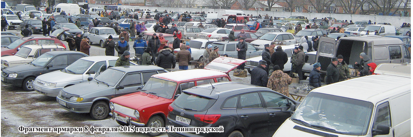
Фрагмент ярмарки 8 февраля 2015 года в ст. Ленинградской